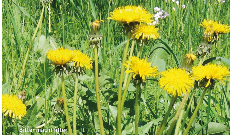
Bitter macht fitter