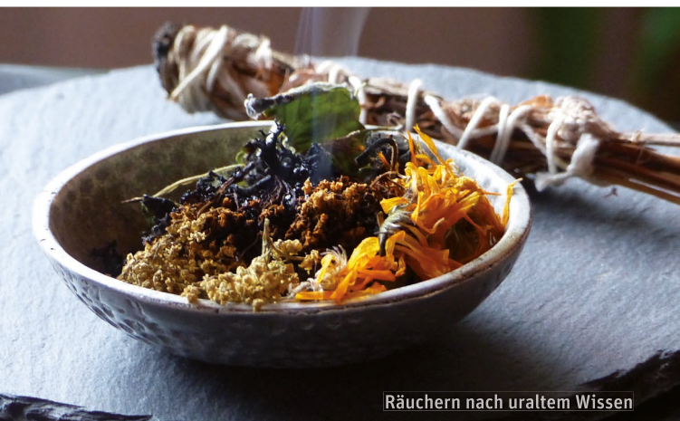
Räuchern nach uraltem Wissen

Druck: Binkert Buag AG, Laufenburg, Auflage 10'000 Exemplare