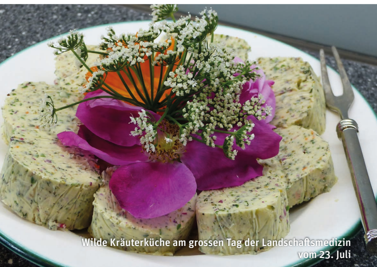
Wilde Kräuterküche am grossen Tag der Landschaftsmedizin vom 23. Juli