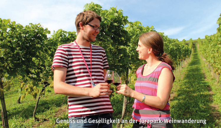
Genuss und Geselligkeit an der Jurapark-Weinwanderung

Samstag 16. September > 14–17 Uhr > Zeiningen