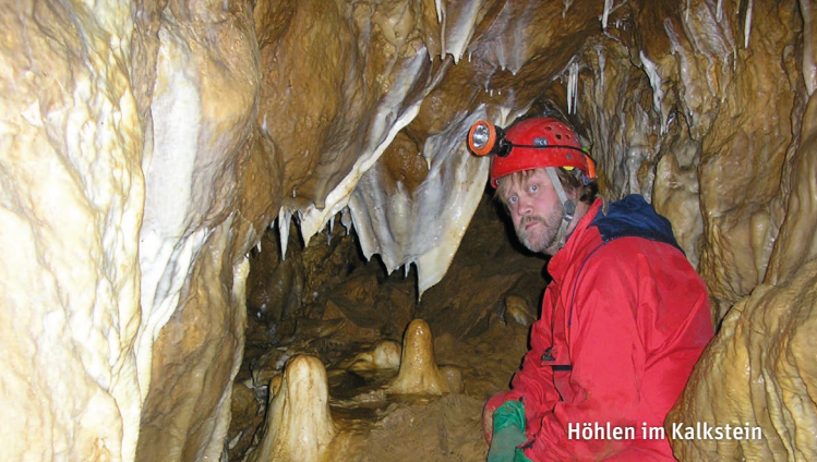
Höhlen im Kalkstein

Samstag 8. April > 13–17 Uhr > Densbüren