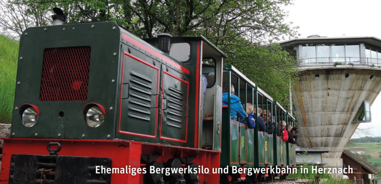
Ehemaliges Bergwerksilo und Bergwerkbahn in Herznach