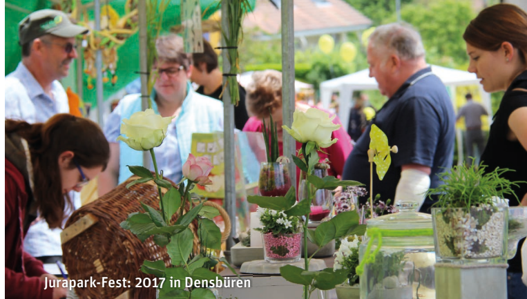
Jurapark-Fest: 2017 in Densbüren

Samstag 14. Oktober > 9.30–17 Uhr > Densbüren