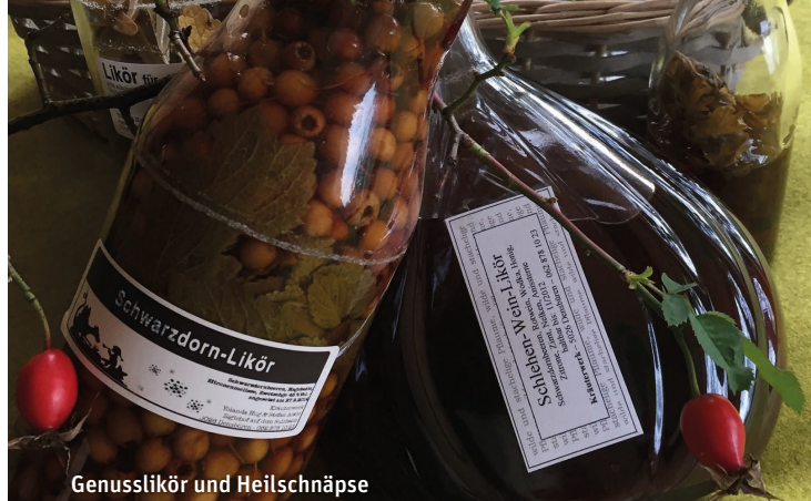
Genusslikör und Heilschnäpse