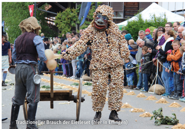
Traditioneller Brauch der Eierleset (hier in Effingen)