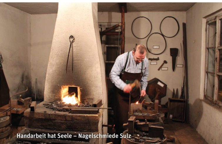
Handarbeit hat Seele – Nagelschmiede Sulz