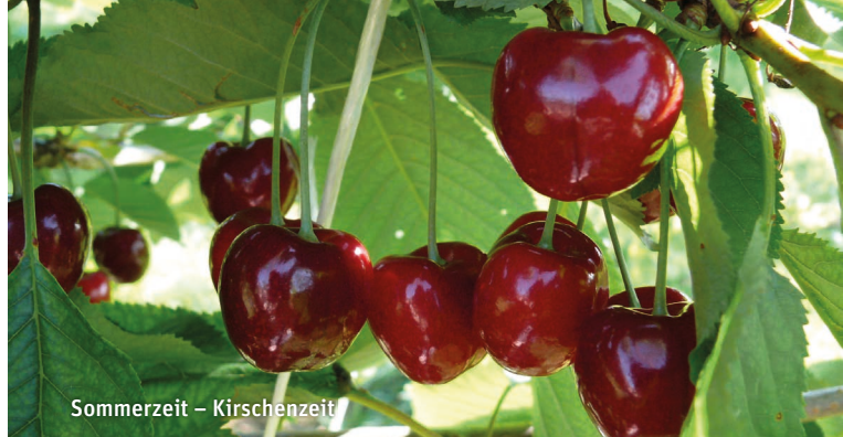
Sommerzeit – Kirschenzeit

➔ Sa, 8. April / Sa, 13. Mai / Sa, 10. Juni / Sa, 12. Aug. / Sa, 9. Sept.